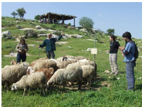
מורי חותם בסדנת מנהיגות בנאות קדומים, השמורה הלאומית של טבע הארץ במקורות ישראל, ליד יער בן שמן

עם פתיחת חופשת הפסח, השתתפו מורי חותם בסדנת מנהיגות שהתקיימה בנאות קדומים. המורים השתתפו במספר פעילויות שהובילו לרפלקציה ושיח על מנהיגות בכיתה ובבית הספר. פעילות עם חץ וקשת הובילה לשיחה על מטרות: כיצד מגדירים ומשיגים מטרות, ומה ניתן ללמוד כאשר מחמיצים אותן. המורים תפקדו כרועי צאן, נלמדו סוגי מנהיגות שונים וחדדו ההאתגרים וההזדמנויות שתפקיד המנהיגות מזמן. מורי חותם הביעו צורך להשתמש בתובנות מהסדנא בכיתותיהם ושמחו על ההזדמנות לחשיבה יצירתית במסגרת משותפת ללמידת עמיתים ולרתימה לחזון חותם. הצלחת הפעילות מחזקת את הצורך שבהמשך פיתוח רשת מנהיגות בחותם והעמקה בנושאים מקצועיים שונים.